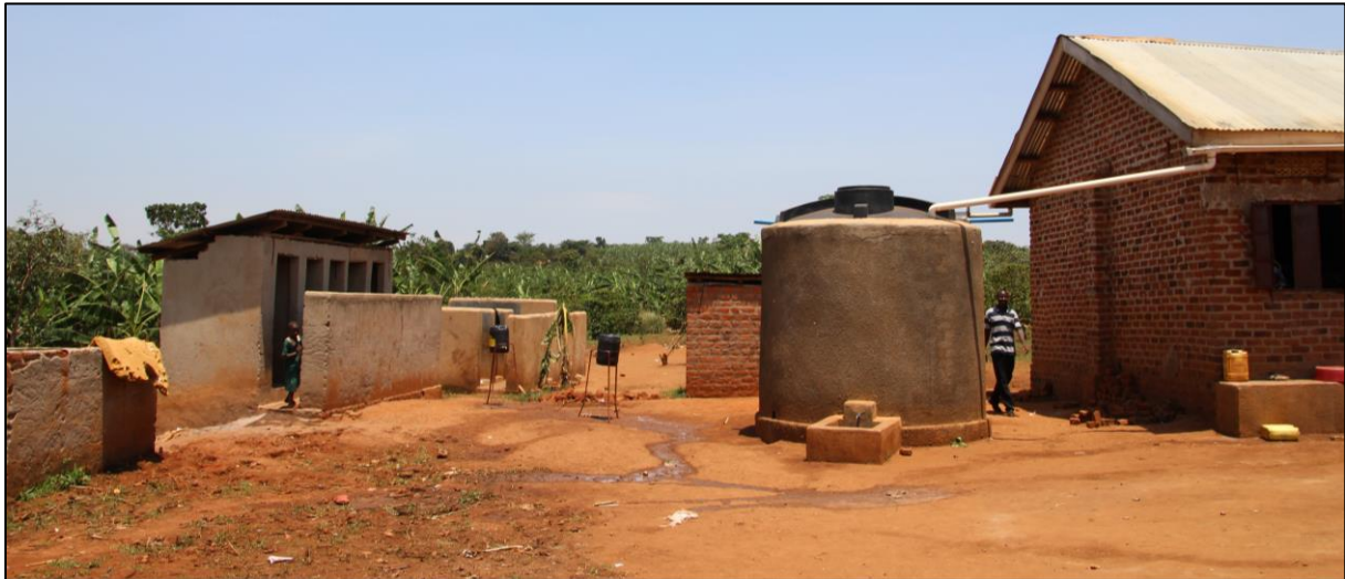
Links de 5 overvolle latrines, die te dicht bij de watertank en de slaapzaal staan

watertank en nieuwe wasgelegenheden. Iedereen is daar erg blij mee en het heeft ook een toestroom van nieuwe leerlingen opgeleverd. Nu is er recent een bezoek geweest van een gezondheidsinspecteur en die signaleerde een groot probleem en dreigt de school te gaan sluiten wanneer dat probleem niet wordt aangepakt. Er zijn nu voor ongeveer 620 leerlingen 5 "wc's" (latrines) beschikbaar en dat is veel te weinig. Bovendien zijn de latrines destijds niet diep genoeg uitgegraven en zitten ze nu helemaal vol.....het stonk er dan ook vreselijk. Een bijkomend probleem is dat de huidige wc's te dicht bij de watertank en bij de slaapzalen staan. Conclusie van de inspecteur: wanneer die situatie niet wordt aangepakt gaat de school dicht.