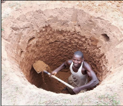
Na 1 dag graven.....

Maandag een week later, dus 9 dagen na de start van de graafwerkzaamheden, werd de pomp geplaatst en was de pomp operationeel. Al het graafwerk werd met de hand gedaan!