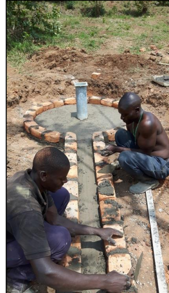
na drie dagen.....