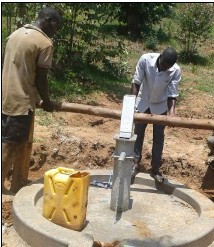
....de pomp is operationeel.