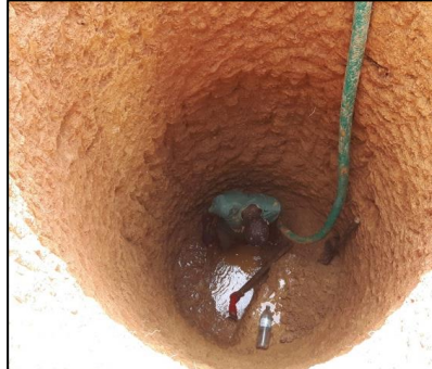
na 2 dagen.....