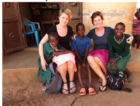
Met Miracle, Agape en Tendo