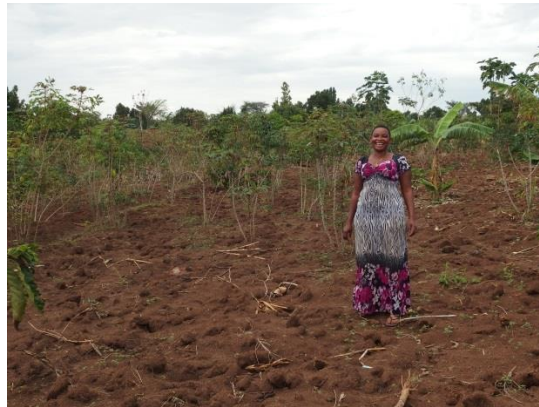
.... en op het stukje grond waar ze groenten wil gaan verbouwen