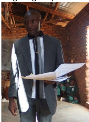
... toespraak van de directeur...